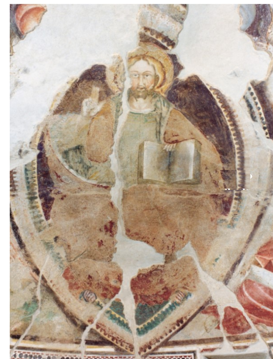
La Majestas Domini (sec. XV) nel catino absidale di Santa Margherita

La leggenda vuole che la fanciulla fosse originaria di Antiochia, figlia di un certo Edesimo, prete pagano. Orfana di madre, fu affidata ad una nutrice cristiana che viveva in campagna e che la convertì al cristianesimo. All'età di quindici anni (si era all'epoca delle persecuzioni di Diocleziano e Massimiano), mentre un giorno, assieme ad altre fanciulle accudiva al gregge di pecore della sua nutrice, Margherita fu vista da Olibrio, governatore della provincia, che viaggiava verso Antiochia. Questi, folgorato dalla bellezza della giovinetta, volle prenderla in moglie, convertendola alla fede pagana. Nonostante le più allettanti promesse, seguite da terribili minacce, la fanciulla rifiutò, non volendo abiurare alla propria fede. Olibrio la fece quindi sottoporre a feroci torture, la fece gettare in una oscura prigione ove le comparve il demonio in sembianze mostruose; Margherita se ne liberò con un gesto di croce. Vinto il demonio, la martire fu nuovamente tentata all'abiura dal governatore ma, essendosi rifiutata, fu sottoposta a nuovi tormenti. Da questi supplizi Margherita uscì indenne, grazie anche alla presenza dello Spirito Santo che la fanciulla aveva invocato onde fortificarla. Molti pagani che assistevano a tale prodigio credettero nel messaggio cristiano e si convertirono sì che, a punizione della loro abiura, furono fatti immediatamente giustiziare. Alla fine, anche la santa fu decapitata.